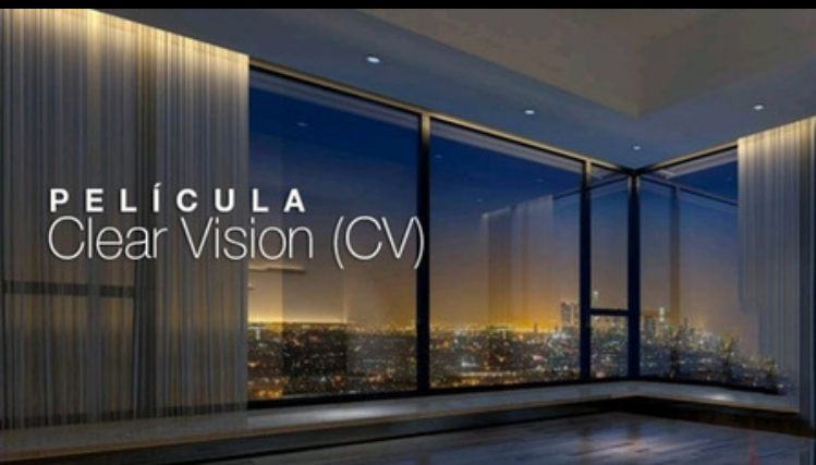
Clear Vision Visibilidad al exterior de día y de noche